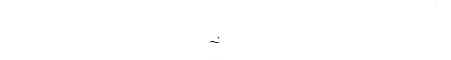
Caption for the photograph at the bottom of the page.